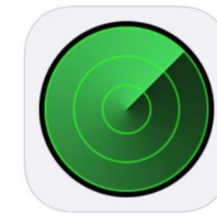
Find My iPhone