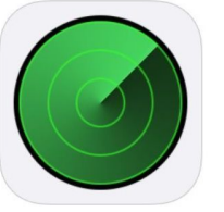
Find My iPhone

下の画面のイメージはiPhoneです。 iPadは異なりますので、ご注意ください。