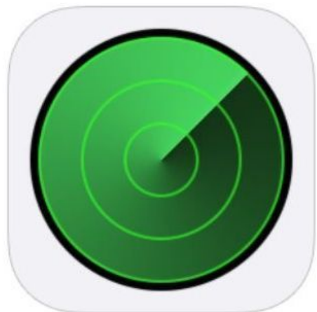
Find My iPhone

自分のiPhone・iPadを紛失・盗難にあった場合、他のiPhone・iPad・Android スマホ・PC からFind My iPhoneのアプリで、 遠隔 で以下の操作可能。